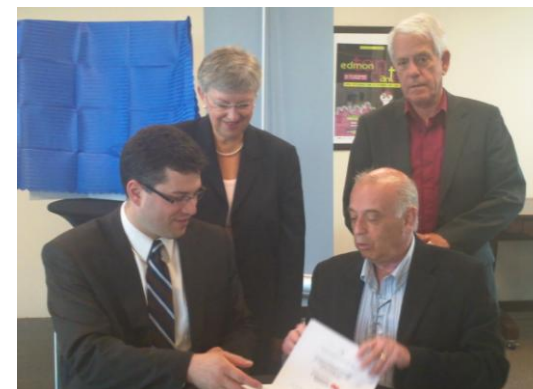
Photo conférence de presse – signature de l'entente entre La Fondation albertaine et Financière Banque Nationale

Pour de plus amples renseignements, veuillez consulter notre site Web : www.fondationfa.ca